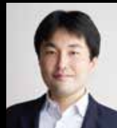
福島県立医科大学 坪倉正治 教授