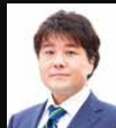
千葉県香取市 伊藤友則 市長