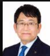
千葉県千葉市 神谷俊一 市長