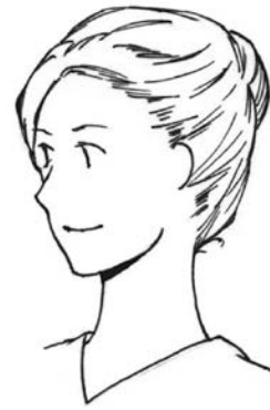
図4 女性 (頭髪の例)